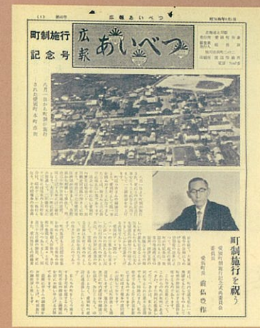
広報あいべつ町制施行記念号(昭和36年)

明治28年に開拓が始められて、やがて「町」になりました。それから約半世紀のときを経て現在の私たちがあります。その50年の足跡を振り返ってみましょう。