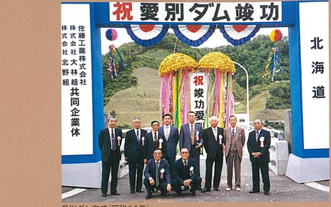
愛別ダム完成(昭和61年)