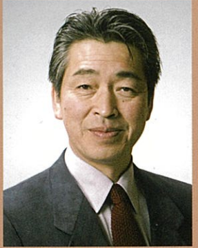
七代目 矢部 福二郎