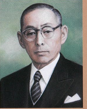
初代 前仏 豊作