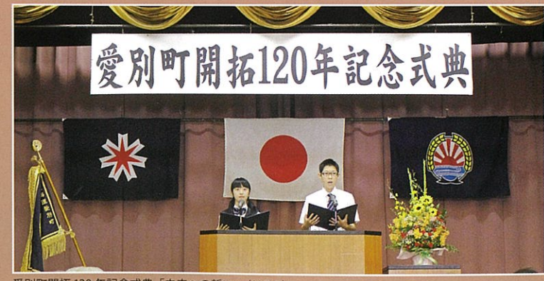
愛別町開拓120年記念式典「未来への誓い」(H26)