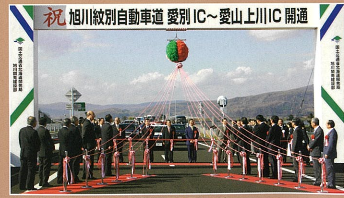
旭川・紋別自動車道 愛別IC・愛山上川IC開通(平成16年)