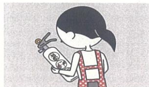
④火災を小さいうちに消すために、消火器等を設置し、使い方を確認しておく