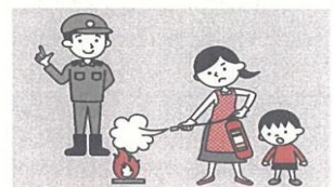
⑥防火防災訓練への参加、戸別訪問などにより、地域ぐるみの防火対策を行う