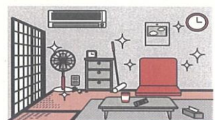
③火災の拡大を防ぐために、部屋を整理整頓し、寝具、衣類及びカーテンは、防災品を使用する