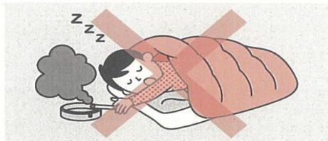
①寝たばこは絶対にしない、させない