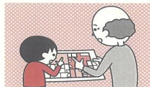
⑤お年寄りや身体の不自由な人は、避難経路と避難方法を常に確保し、備えておく