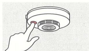
②火災の早期発見のために、住宅用火災警報器を定期的に点検し、10年を目安に交換する