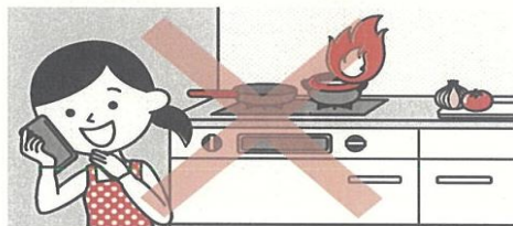
③こんろを使うときは火のそばを離れない