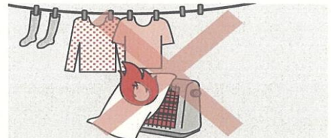
②ストーブの周りに燃えやすいものを置かない