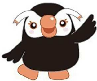
政府広報キャラクター エリカちゃん