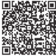
札幌国税局 ホームページ

◆消費税の基本的な仕組みから理解されたい方向けの「インボイス説明会」も開催しています！