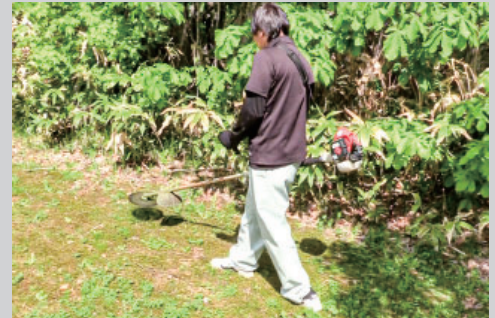
地域の方が運動できる場を整えるために、公園の草刈りなども行いました。