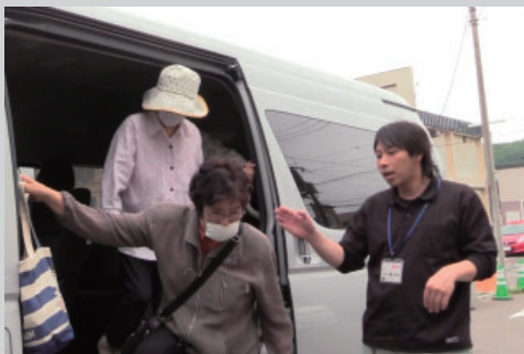
買い物ツアーは、毎回楽しくて、心のよりどころになっている方もいました。