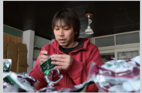
ビーツの加工品のシール貼りの様子。ふるさと納税の申込が来たら対応しました。