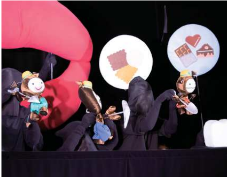
↑台本や小道具も全てがメンバーの手作り