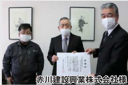
赤川建設興業株式会社様