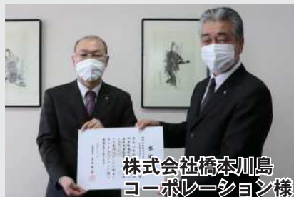
株式会社橋本川島コーポレーション様