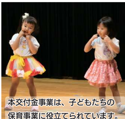
本交付金事業は、子どもたちの保育事業に役立てられています。

この交付金は、発電用施設周辺の市町村が行う公共施設の整備や、地域の活性化に資する事業に対して交付されるものです。愛別町は、愛別発電所が愛山に設置されていることにより、交付金の対象地域となっています。令和3年度においては、保育事業の充実を図るために、交付金の460万4千円を愛別町立さくら保育所および愛別幼稚園の運営費に充てました。