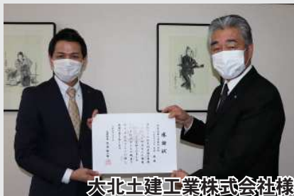
大北土建工業株式会社様

2月2日、町道の側溝整備作業にご奉仕された株式会社橋本川島コーポレーション様、十四線資材置場の資材整理作業にご奉仕された大北土建工業株式会社様、厚生会館・伏古生活改善センターの雪下ろし作業にご奉仕された赤川建設興業株式会社様、町道の側溝浚渫作業にご奉仕された株式会社盛永組様、旧中里小学校の草刈り作業にご奉仕された株式会社田中工業様に対し、感謝状を授与いたしました。この度のご奉仕に心より感謝を申し上げます。