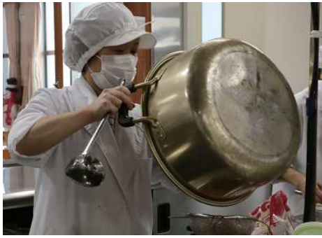
↑子どもたちが喜ぶ顔を想像して作っています