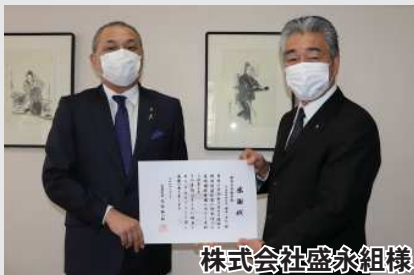
株式会社盛永組様