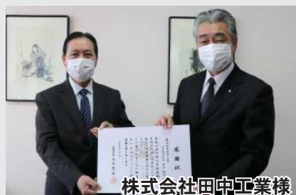
株式会社田中工業様