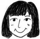
今月の担当 西部保健師

血圧とは、血液が動脈を流れる時に、血管の内側にかかる圧力のことです。「上の血圧」や「下の血圧」と呼ばれています。上の血圧は「収縮期血圧」といい、心臓がぎゅっと縮んで、血液を全身に送るときにかかる血管の圧力です。押し出された血液は動脈に一気に流れ込み、血管に最も強い圧力がかかるため、血圧値は最大となります。収縮期血圧は、全身へ血液を巡らすために必要な血圧なのです。