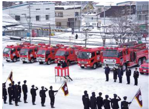
令和2年愛別消防出初式の様子

※新型コロナウイルス感染拡大の状況によっては、開催を中止させていただきます場合があります。