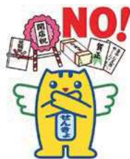
広報誌「総務省 2021年12月号」より

そこで、この機会に皆さまに改めてご理解いただきたいのが、きれいな政治、お金のかわらない政治の実現、選挙の公正の確保を目指す「三ない運動」（贈らない、求めない、受け取らない）です。