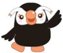
政府広報キャラクター エリカちゃん

1月21日～2月20日まで、役場庁舎入口（保健福祉課側）に返還要求署名コーナーを設置します。皆さまの思いを署名に結集しましょう。