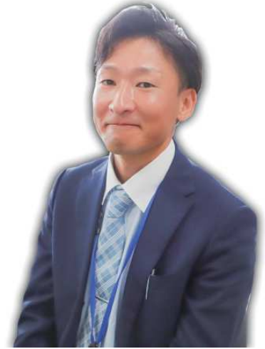
地域おこし協力隊

現在は、産業振興課で、愛別町の特産品や、ビーツの販売促進などの仕事をしています。愛別町を盛り上げていきたいです。よろしくお願いたします！