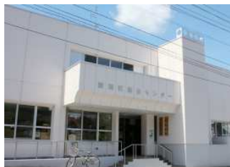
・愛別町総合センター