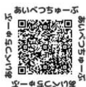
公式 YouTube チャンネル

『広報あいべつ』は、愛別町ホームページでも公開している他、旭川ケーブルテレビポテでも放送しており、写真等がカラーでご覧いただけます。