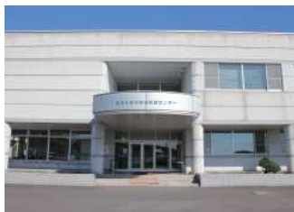
・愛別町農村環境改善センター