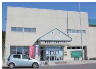
・愛別町 B & G 海洋センター