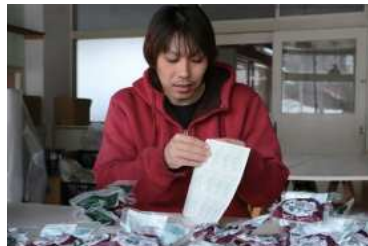
▲加工品のシール貼り作業をしています！（藏前）