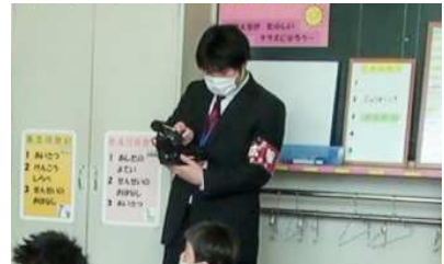
▲小学校の入学式に撮影へ行きま した！（谷合）