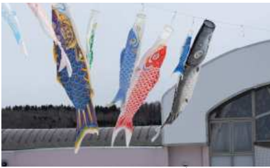
▲幼児センターの鯉のぼり