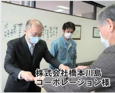
株式会社橋本川島コーポレーション様