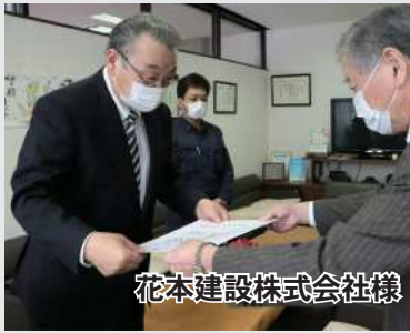
花本建設株式会社様

1月26日、旧協和小学校および旧中里小学校敷地の景観整備作業にご奉仕された花本建設株式会社様、協和第一排水路の草刈り泥上げ作業にご奉仕された株式会社橋本川島コーポレーション様、エチラスケップ川の浚渫作業にご奉仕された株式会社盛永組様に、感謝状を授与いたしました。また、2月12日に、高齢者生活福祉センターの屋根雪下ろしおよび除排雪作業にご奉仕された北進開発株式会社様に、感謝状を授与しました。 この度のご奉仕に心より感謝を申し上げます。