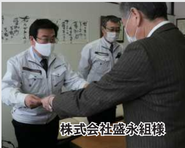
株式会社盛永組様