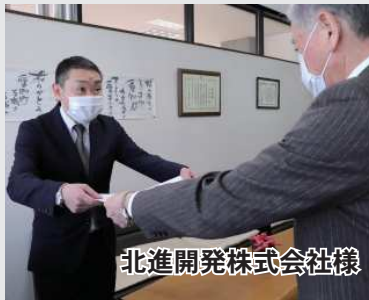
北進開発株式会社様