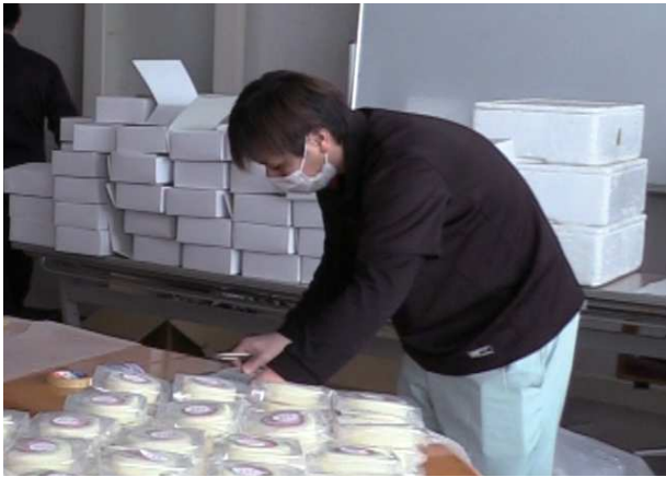
▲ビーツの試作品の箱詰め作業中です！（藏前）