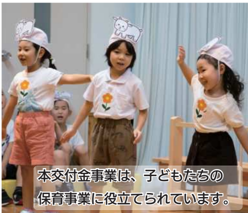
本交付金事業は、子どもたちの保育事業に役立てられています。

令和2年度においては、保育事業の充実を図るために、交付金の456万4千円を愛別町立さくら保育所および愛別幼稚園の運営費に充てました。