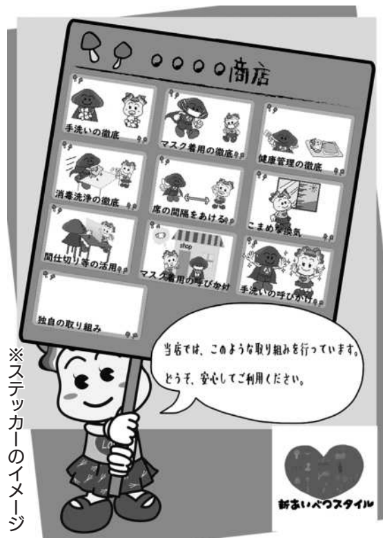
※ステッカーのイメージ

消毒の実施やマスクの着用、密接しないための距離の確保や、来店者へもマスクの着用等の感染防止対策の協力を依頼する等、事業所に対応可能な取組を実施し、町が配布するステッカーを掲示する事業者