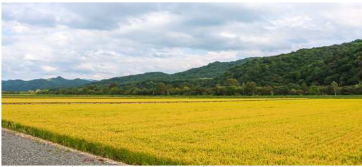
↑一面に広がる圃場。細やかな管理がなされています。