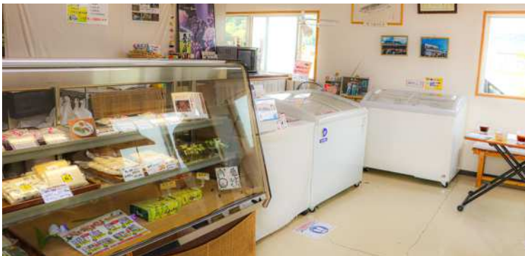
↑直売所に入ると、おいしいお餅や大福が出迎えてくれます。