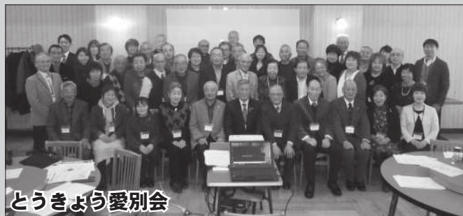
とうきょう愛別会