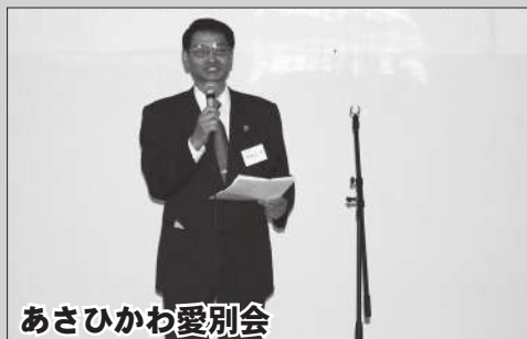
あさひかわ愛別会

愛別町出身者や、ゆかりのある方による「ふるさと愛別会」の総会が、旭川(10月18日)、札幌(10月25日)、東京(11月30日)において開かれました。