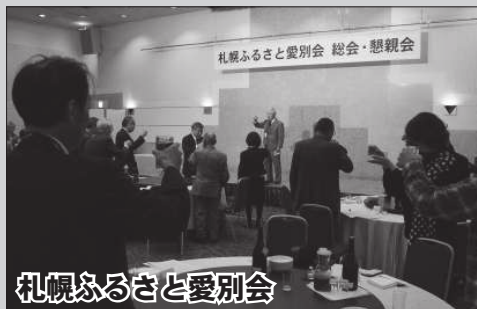
札幌ふるさと愛別会

総会では、会員の親睦とふるさと愛別の応援団として活動することを確認し、懇親会では愛別和酒「ふしこ」で乾杯し、愛別町のイベントの様子を紹介する上映会なども行われました。参加者はふるさと愛別に思いを馳せ、昔話に花を咲かせました。