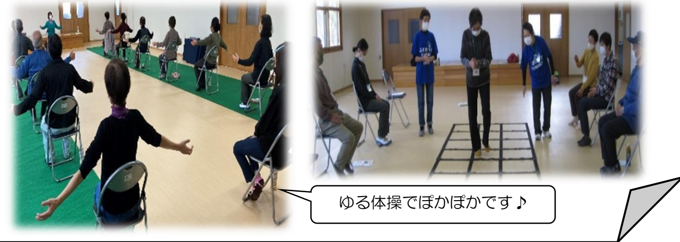
ゆる体操でほかほかです♪

ふまねっと運動やゆる体操を行いました。ゆる体操はみなさん初めてでしたが、体全体がほかほかになり、気持ちよかったです。今後はフロアカーリングや頭の体操も行っていく予定です。