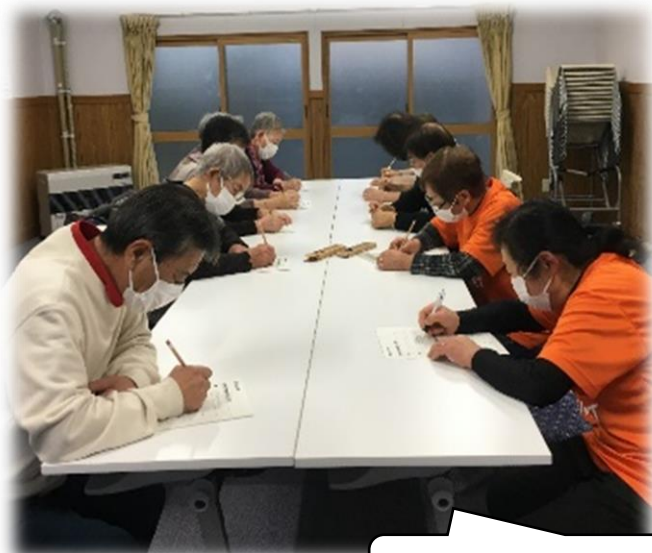
脳トレにとり組み中！！

ふまねっと運動とお茶を飲みながら楽しくおしゃべりやレクレーションをしています。11月は7名の方が参加し、「昨日の朝ごはん」を思い出してもらおう脳トレを行いました。