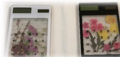
押し花の電卓です