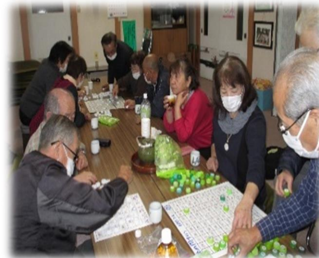
ペットボトルキャップならべを頑張っています！

11月に第1回目のサロンを実施し、12名の方が参加されました。みなさんがやりたいことをやり、楽しくひと時をすごしてもらおう場として活動していきます。