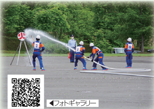
◀フォトギャラリー

現在、愛別町では「地域防災の要」である消防団員の数が不足しています。災害が起きたとき、消防団員は、迅速な対応で地域住民を守ってくれる必要不可欠な存在です。災害に強いまちづくりのためには、消防団員の力が必要です。興味のある方、入団を希望する方は、お気軽に下記までお問い合わせ下さい。