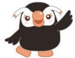
政府広報キャラクター 「エリカちゃん」