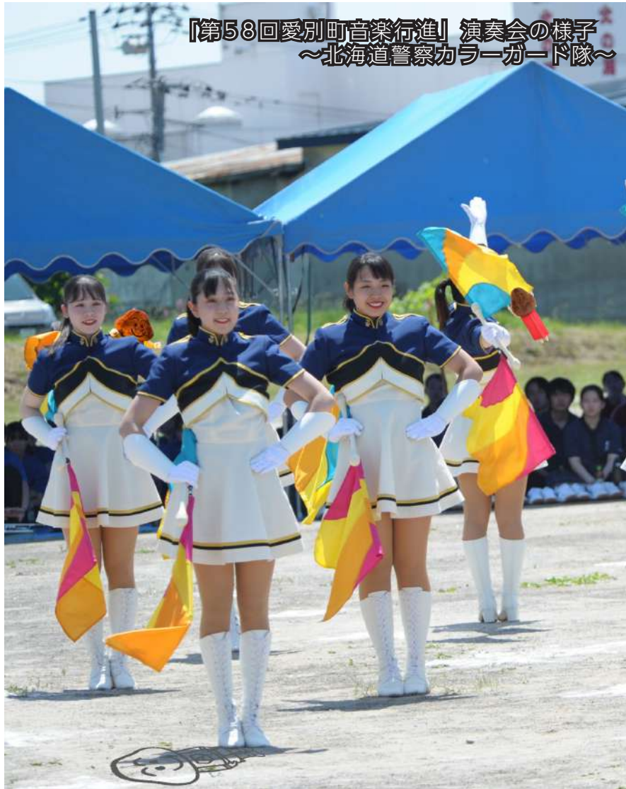
『第58回愛別町音楽行進』演奏会の様子 ~北海道警察カラーガード隊~

町公式 Twitterで人気の「あいちゃんマンを探せ！」は、皆さんご存じですか？下の写真の中にあいちゃんマンが3人隠れています。ぜひ探してみてください！ 答えは、このページの一番下に掲載しています。