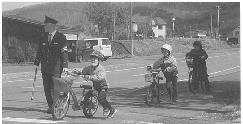
交通安全教室の様子

中学生以下200人×6,000円 120万円 それ以外の町民 1,000人×3,000円 300万円 合計420万円