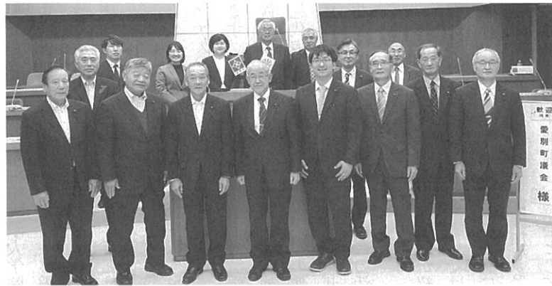
浦幌町議会の議場にて

ただ、浦幌町議会では町民の声を聴く機会が多くあると感じました。アンケート、意見箱、年に1回の議会報告会、年4回のまちなかカフェ、町議会など、町民の声を聴取する一方で、各議員が自らの考え方も発信しつつ、交流する機会も設けているようです。全体の質疑応答の後、浦幌町議会からの提案で2つのグループに分かれてのグループワークが行われました。全体質疑では聞けなかったような細かい事や、新任議員の方へ個別に聞きたかった事を各議員から質問することができました。浦幌町議会は議会改革の先進地であり、会議や懇談のノウハウをしっかりと持っている議会であると再確認しました。 浦幌町議会と愛別町議会を比較すると、町民の意見を聴く「広聴」の機能に明らかな差が感じられました。愛別町議会では平成25年と平成29年に議会懇談会が行われましたが、その後の定期的な開催は無く、議員個人による町民からの意見聴取のみが行われている現状です。 今回、浦幌町議会を視察して、各議員の考え方、議会の雰囲気、目標としていることについて、愛別町議会とのギャップを感じました。この視察を一つの契機として、愛別町議会でも町民