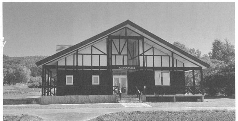
あいべつ体験農園の管理棟