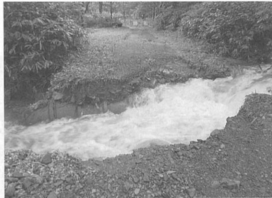
災害時の協和パンケ左沢道路