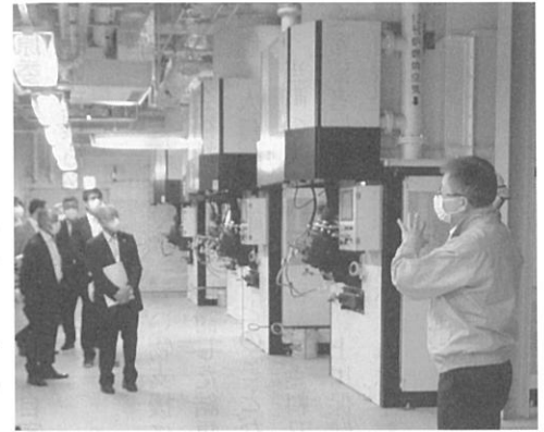
旭川聖苑（火葬場）バックヤード

備に2基）の火葬炉があり、年間400体の火葬をおこなっている。合葬墓には1万体の収骨が可能で、現在は約2500体が収骨されていると説明を受けた。