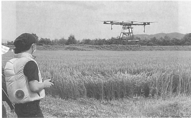
ドローンによる水田防除

中富産業振興課長補佐 農業者の全体会議や地区別の懇談会で周知を図っている。2年間の事業経過を総合的に考えて、有効利用していただけるようになる。